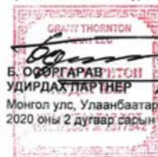
Б. ООРЖИРАВ УДИРДАХ ПАРТНЕР Монгол улс, Улаанбаатар хот 2020 оны 2 дугаар сарын 28

Энэхүү тайланг "Компанийн тухай" хуулийн 94-р зүйлд заасны дагуу зөвхөн компанийн хувьцаа эзэмшигчдэд зориулсан ба бусад өөр этгээдэд зориулаагүй болно. Бид энэхүү тайлангийн хүрээнд бусад аливаа нэгэн гуравдагч талын өмнө хариуцлага хүлээхгүй.